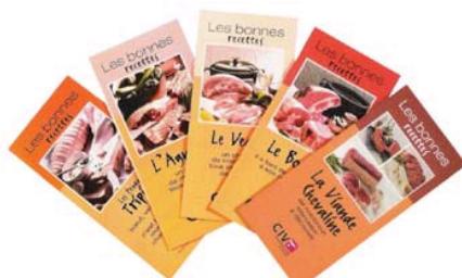
Les bonnes recettes de viande chevaline