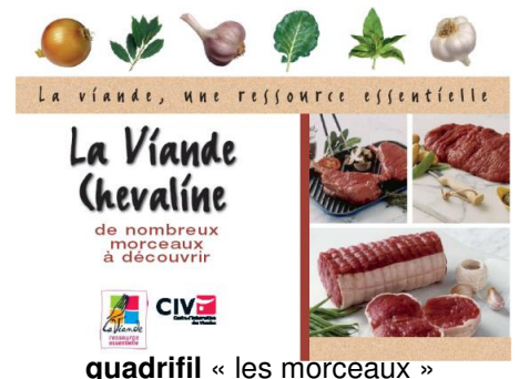
quadriple « les morceaux »

Pour plus de renseignements, contactez Timothé Masson Fédération Nationale du Cheval – 11 rue de la Baume – 75 008 Paris Tél : 01 45 63 05 90 – Fax : 01 45 63 01 41 Courrier : timothe.masson@fnsea.fr