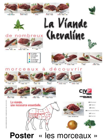
Poster « les morceaux »